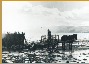
Récolte de varech sur les battures de Saint-Bernard-sur-Mer, 1942. Ciné-photographie, négatif C-23750.