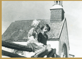
La chapelle de procession de Saint-Louis, 1942. Ciné-photographie, négatif 1886, collection Rosaire Tremblay.