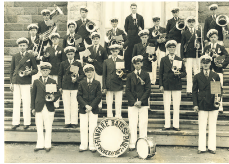
La fanfare de Baie-Saint-Paul, vers 1930.