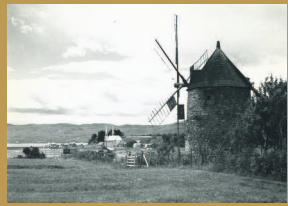
Le moulin à vent de L'Isle-aux-Coudres. Au loin se profile l'église de Saint-Louis, 1942. Ciné-photographie, négatif 5898.

Parmi les autres toponymes officiels de la municipalité, on retrouve le ruisseau rouge, qui se nomme ainsi en raison de la couleur de ses eaux, causée par la terre de son lit. Ce ruisseau se trouve sur la Pointe du bout d'en bas qui correspond à la pointe est de l'île.