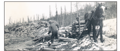
Chargement du bois, vers 1950.

Ce fonds d'archives fournit des renseignements portant sur l'exploitation forestière de la compagnie Abitibi Price menée par sa division Beupré dans Charlevoix. Il témoigne des moyens et techniques d'exploitation utilisés pour les opérations forestières. On y retrouve plusieurs documents photographiques et textuels. Récemment, après la fermeture d'Abitibi-Bowater (division de Beupré), le C.A.R.C. a fait l'acquisition de tous les autres documents qui manquaient au fonds.