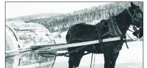
Durcissement de la neige sur le lac Keable, parc national des Grands-Jardins, vers 1950.