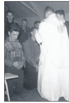
La messe de minuit au camp, parc national des Grands-Jardins, vers 1957.

et contrôlent la côte de Charlevoix depuis La Malbaie jusqu'à Rivière Noire. L'activité forestière a occupé pendant près de vingt ans une place importante dans l'économie de la région charlevoisienne.