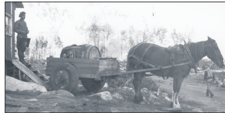
Lac Équerre, transport de l'eau pour l'approvisionnement des camps, 1946.