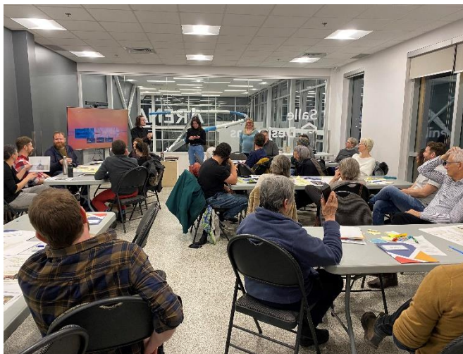
Consultation à Baie-Saint-Paul

La seconde étape consistait à rassembler les personnes intéressées autour d'ateliers de cocréation dans chacune des municipalités, afin de bien comprendre l'identité du milieu,