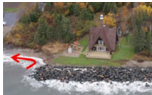
Exemple de maladaptation : un enrochement destiné à protéger une habitation peut accélérer l'érosion des rives voisines.

Enfin, il importe de mentionner que la mise en place de mesures d'adaptation peut être complexe. Une bonne planification est requise pour éviter la maladaptation, c'est-à-dire aggraver ou déplacer un problème, plutôt que de l'atténuer.