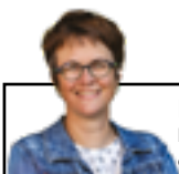
Par Josée Bouchard M.ATDR, conseillère en transition climatique