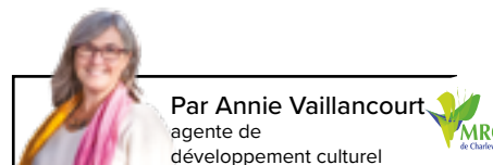
Par Annie Vaillancourt agente de développement culturel