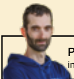
Par Jérôme Fournier ingénieur forestier