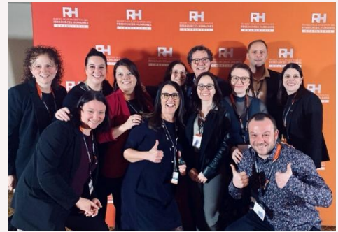
Comité organisateur 2024