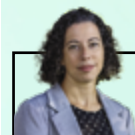
Par Marylène Thibault, urb coordonnatrice à l'aménagement du territoire