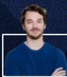
Par Alexis Gagnon-Tremblay, conseiller en développement territorial