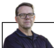
Par Luc Larouche , technicien en évaluation et responsable du service d'évaluation