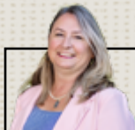
Par Karine Horvath, directrice générale de la MRC