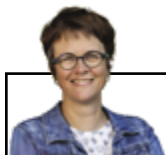
Par Josée Bouchard, M.ATDR, conseillère en transition climatique