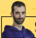
Par Jérôme Fournier, ingénieur forestier