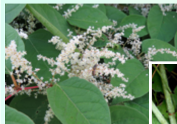
© Ministère de l'Environnement, de la Lutte contre les changements climatiques, de la Faune et des Parcs